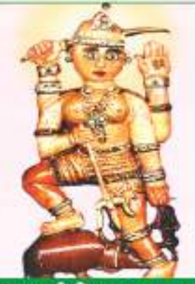
જય શ્રી વિશલ માતાજી